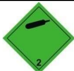
Etiqueta 2.2. Gas no inflamable, no tóxico