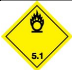
Etiqueta 5.1. Sustancias comburentes