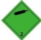
Etiqueta 2.2. Gas no inflamable, no tóxico