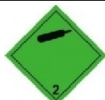
Etiqueta 2.2. Gas no inflamable, no tóxico