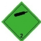
Etiqueta 2.2. Gas no inflamable, no tóxico